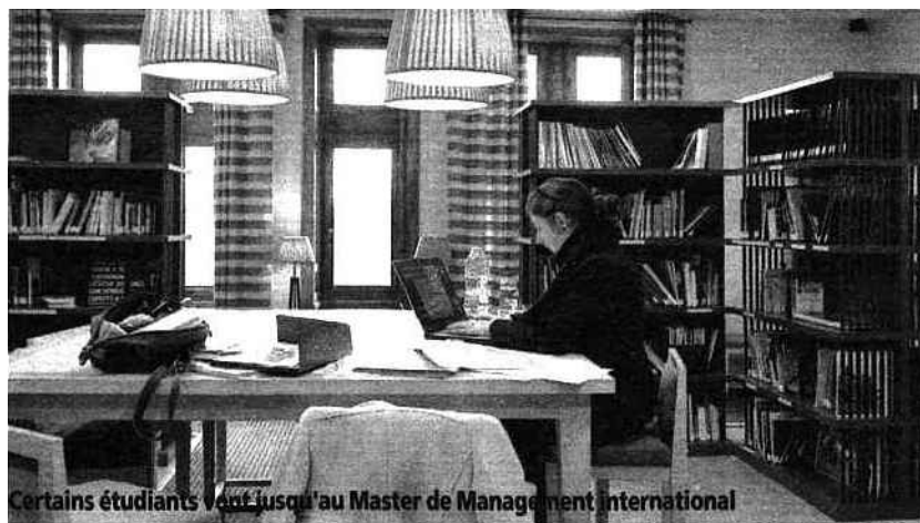
Certains étudiants vont jusqu'au Master de Management international