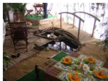
A step in Eden

De la jungle à la sensualité en passant par le jardin d'enfants, ce n'est pas moins de 90 concepts qui ont vu le jour depuis sa création (ci-dessous, les concepts "Deep Ocean" et "A step in Eden", deux exemples de brillantes créations des étudiants). En moins de deux mois ils doivent se donner les moyens de décliner dans un espace de 70 m 2 la thématique de leur choix. Une seule contrainte et pas des moindres : le budget décoration est limité à 50 €, le prix de revient par couvert est de 7 €. Les étudiants doivent faire appel à des partenaires afin d'obtenir, en toute confiance, le prêt des matériels ou l'allocation d'une somme nécessaire à la concrétisation de leur concept.