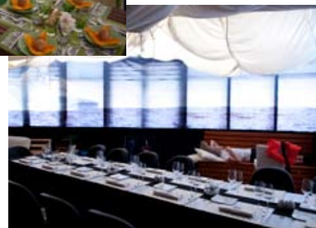
Deep ocean - Tous sur le pont !